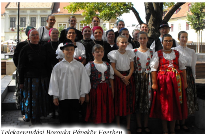
Telekgerendási Borouka Pávakör Egerben.

Az előadást a zsűri a Népzenei Együttesek Országos Minősítése alapján arany fokozatra minősítette és a Magyar Kórusok, Zenekarok és Népzenei Együttesek Szövetsége és a Tradíció Alapítvány az Aranypáva Nagydíjas Gálán nyújtott kiváló közreműködéséért különdíjban részesítette. Gratulálunk!