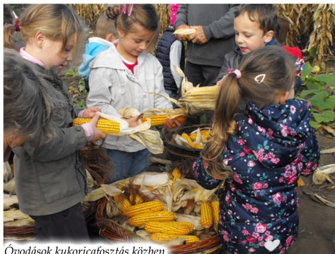
Óvodások kukoricafosztás közben

A munka végeztével az asszonyok megvendégelték a „munkásokat”, pogácsával, süteménnyel, meleg teával kínálták a gyerekeket és a felnőttek számára az ilyenkor szokásos melegítő pálinka sem maradhatott otthon.