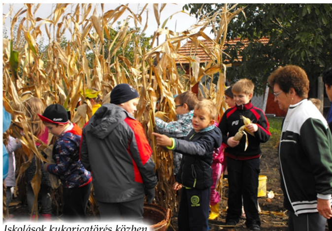
Iskolások kukoricatörés közben

A szorgos kicsi kezek ügyesen törték, hordták kosarakba, majd az asszonyok útmutatásai mellett fosztották és morzsolták a kukoricát. A férfiak bemutatták a szárvágás és a kúprakás fortélyait.